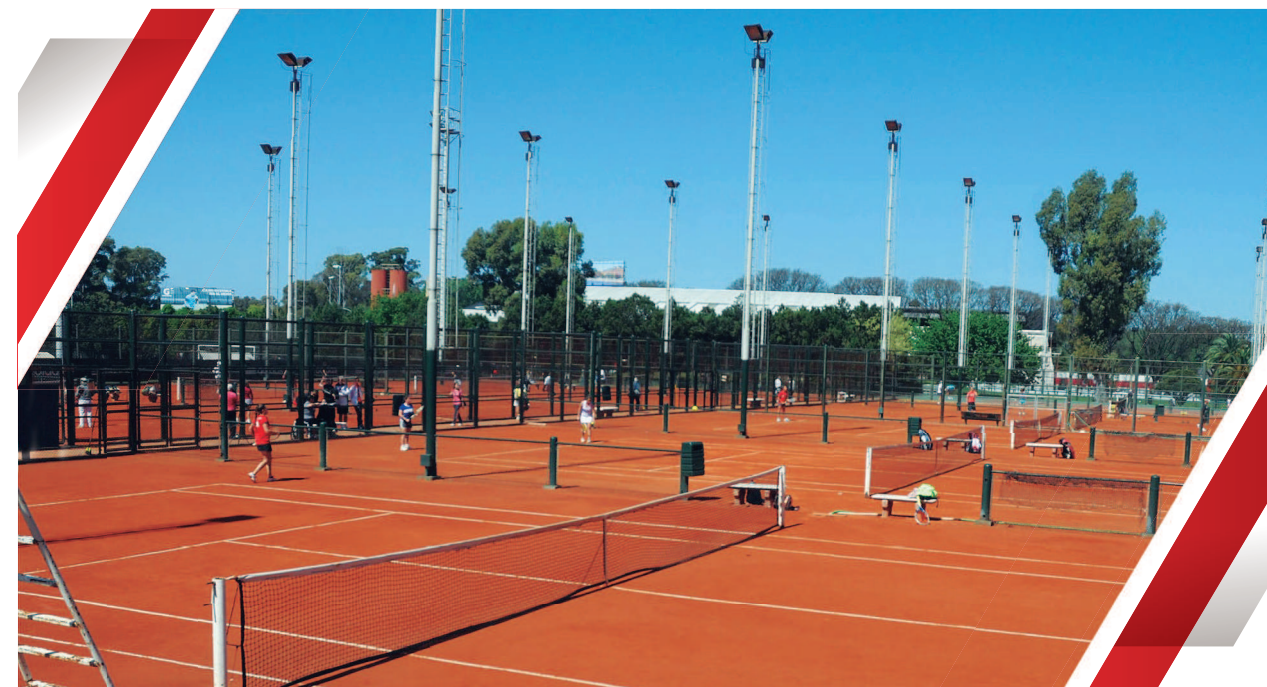
Canchas de Tenis.