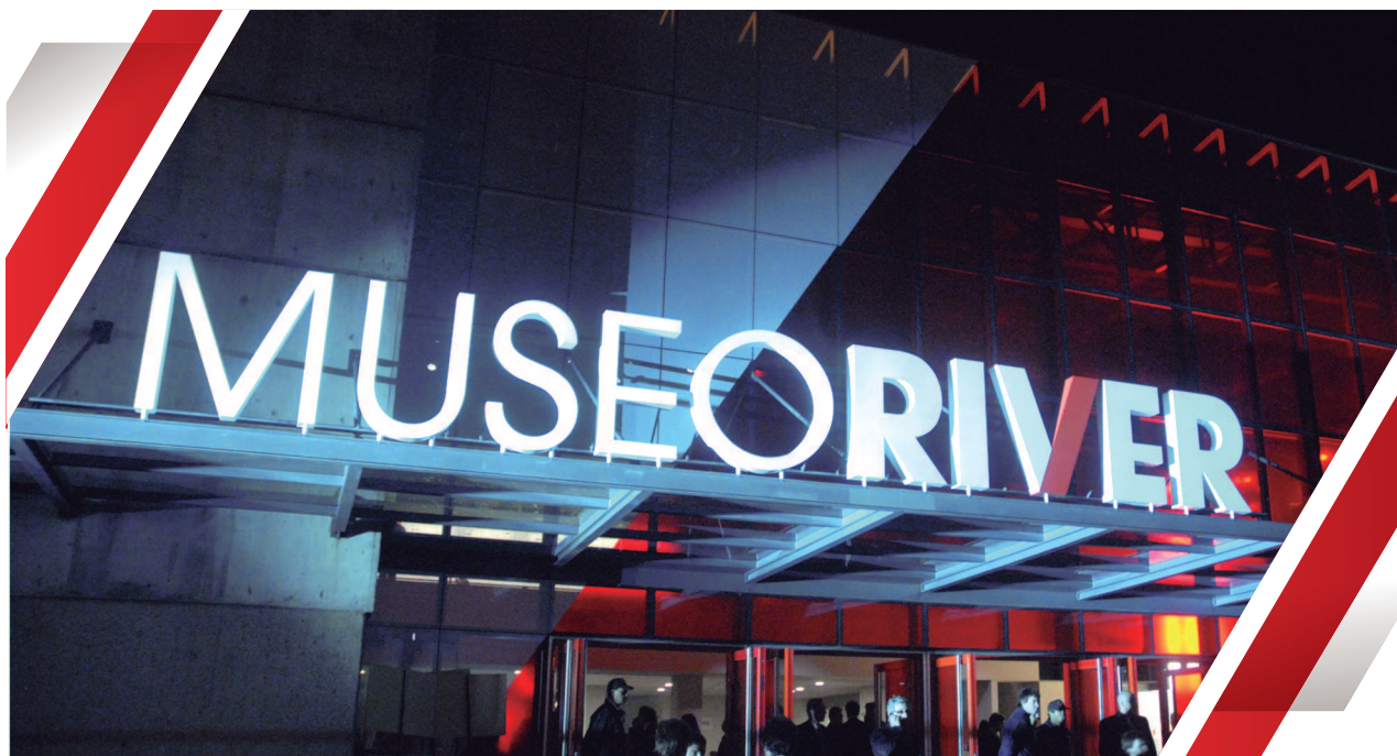
Fachada del Museo River, sobre la Avenida Figueroa Alcorta.