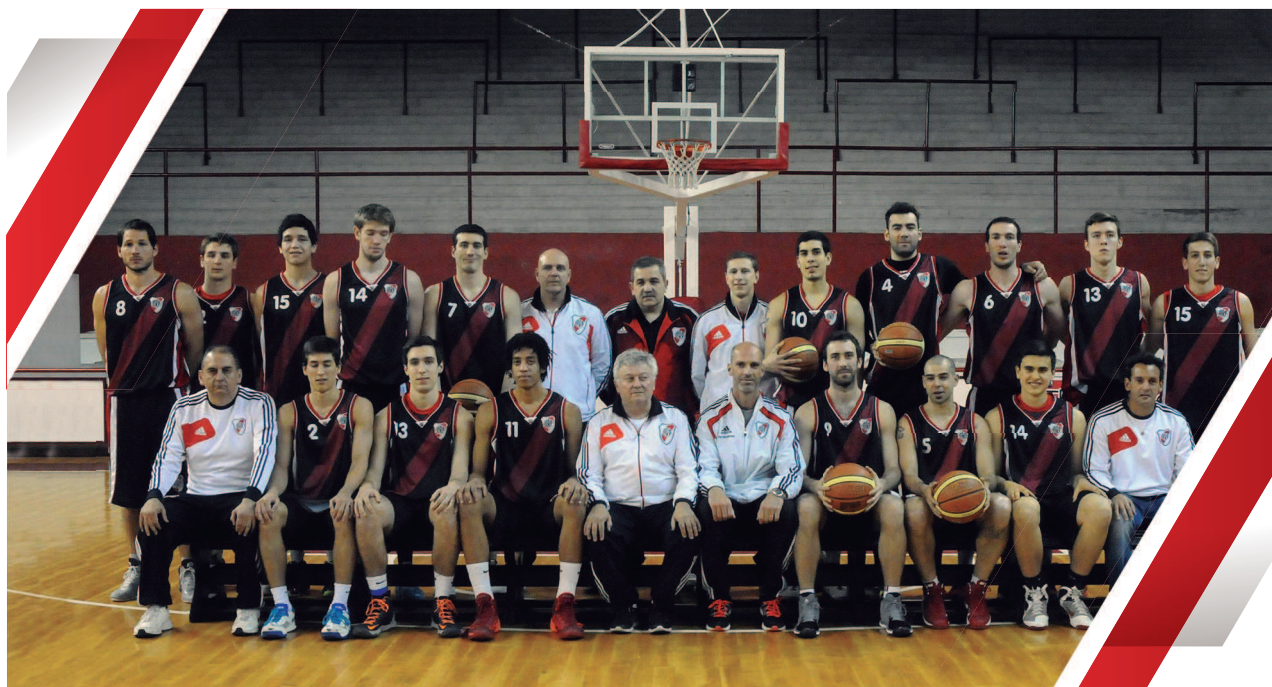
Presentación del plantel de Básquetbol.