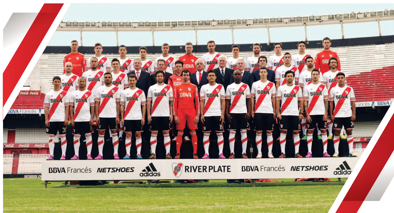
Plantel de Fútbol Profesional, temporada 2013 / 2014.