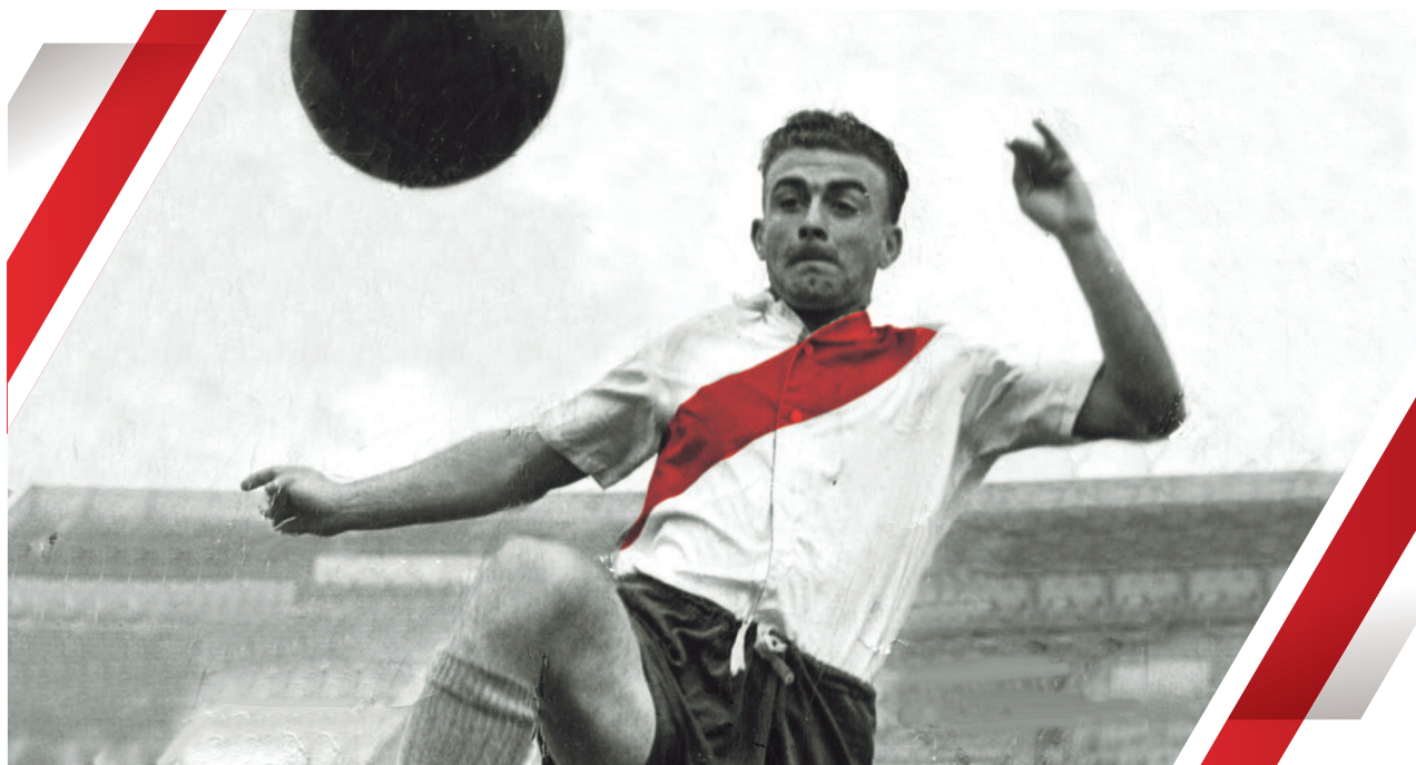
Alfredo Di Stéfano, año 1947.

Es preciso que la presente Memoria y Balance registre la noticia de la partida de uno de los mejores jugadores de todos los tiempos que vistieron la camiseta de River (el mejor, según muchos): Alfredo Di Stéfano, la cual tuvo lugar el día 7 de julio de 2014.