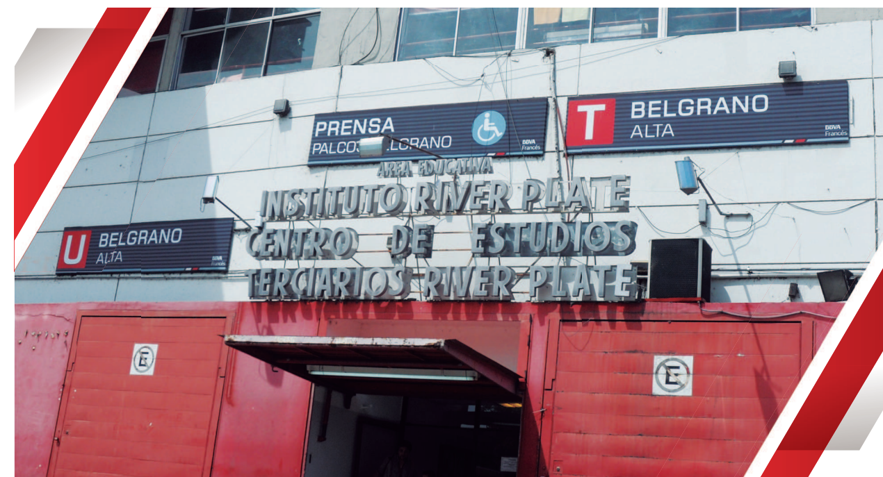
Fachada del Instituto River Plate.