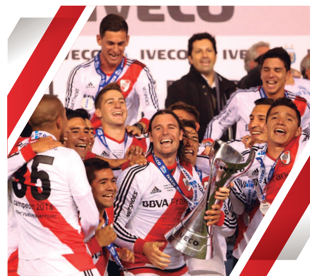
CAMPEÓN DEL TORNEO FINAL AFA 2014